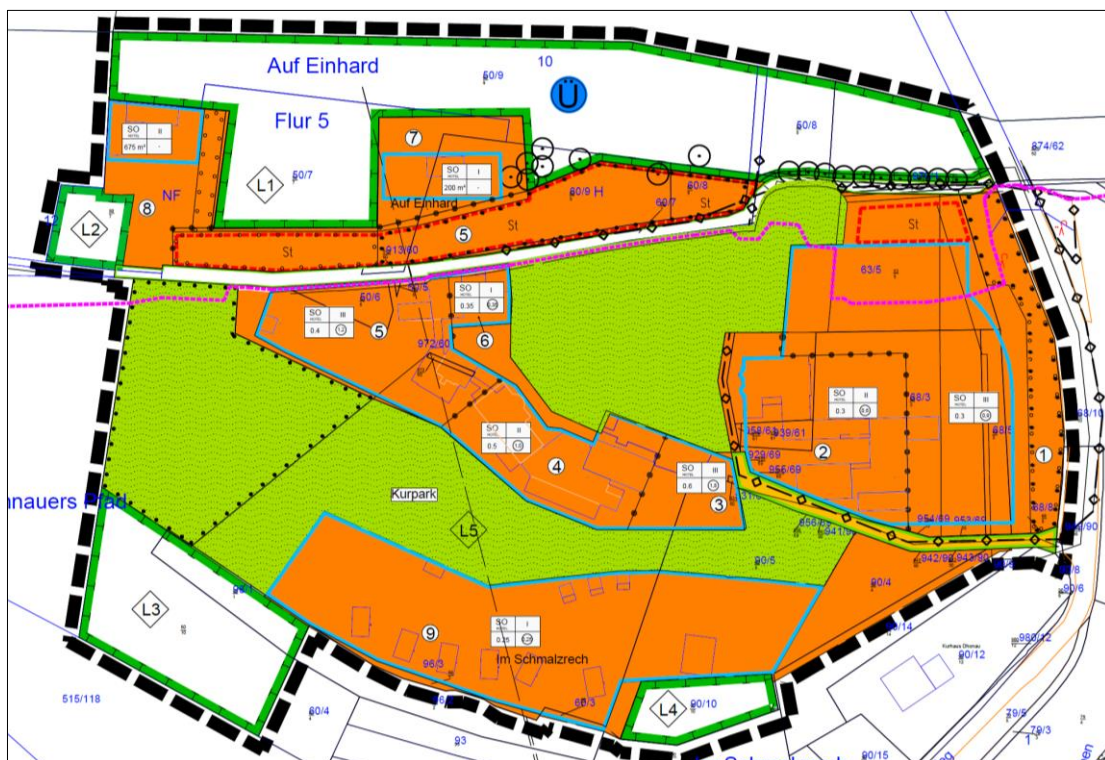
Abbildung 1: Ausschnitt aus dem bisher rechtskräftigen Bebauungsplan „Am alten Schloß, 4. Änderung“ mit Darstellung des auch für die 5. Änderung geltenden Geltungsbereichs.

Die folgende Abbildung zeigt den entsprechenden Geltungsbereich.