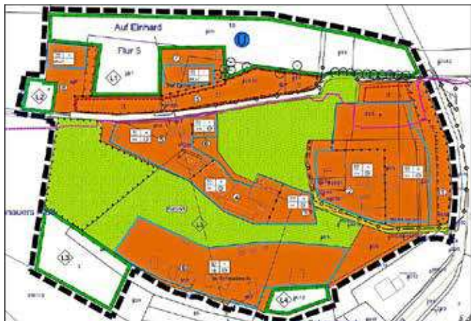
Verbandsgemeindeverwaltung Nahe-Glan Fachbereich 3 Natürliche Lebensgrundlagen und Bauen

Die genaue Lage des Plangebiets in der Gemarkung Sobernheim ist dem nachfolgend abgedruckten Lageplan zu entnehmen.