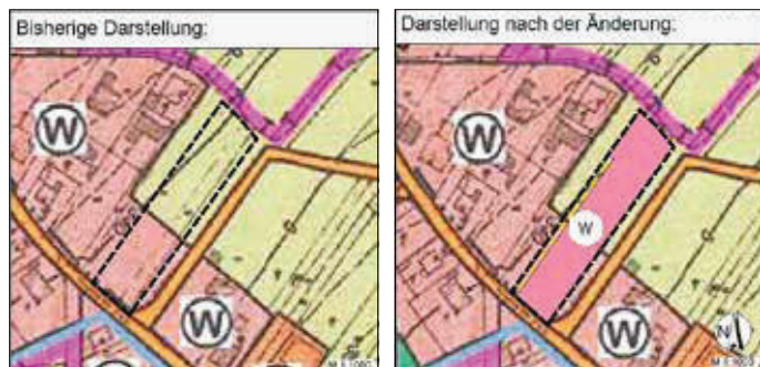
Verbandsgemeindeverwaltung Nahe-Glan Fachbereich 3 Natürliche Lebensgrundlagen und Bauen

Die ca. 0,32 ha große Fläche befindet sich innerhalb der Ortsgemeinde Lauschied und umfasst in der Flur 8 die Flurstücknummer 104.